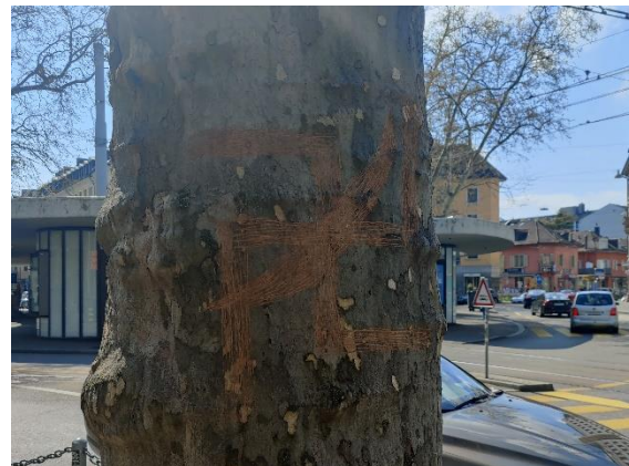
Der GRA gemeldeter Vorfall: ein eingeritztes Hakenkreuz in einem Baum am Zürcher Bellevue

Trotz der gestiegenen Anzahl der erfassten Vorfälle, kann weiterhin von einer hohen Dunkelziffer von nicht gemeldeten rassistischen und antisemitischen Vorfällen ausgegangen werden, da nur die wenigsten Zwischenfälle den Weg in die Medien finden oder zur Anzeige gebracht werden.