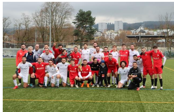
Freundschaftsspiel zwischen dem FC Hakoia und dem FC Kosova

und machte auch nach dem Eintreffen der Polizeibeamten, vor etlichen Augenzeugen, rassistische Aussagen. Die Staatsanwaltschaft befand den Pensionär der Tötlichkeiten, der Beschimpfung und des Aufrufs zur Rassendiskriminierung für schuldig und verurteilte diesen zu einer Geldstrafe.