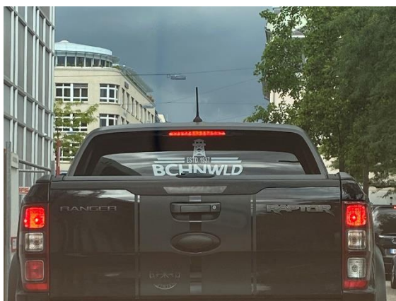
Der GRA gemeldeter Vorfall: ein auf den Nationalsozialismus verweisendes Symbol an der Heckscheibe eines Pickups

Das Jahr 2021 war geprägt von besonders vielen Sachbeschädigungen und Sprayereien mit nationalsozialistischen Symbolen im öffentlichen Raum. Als einer der gravierendsten Vorfälle gilt die im Februar 2021 verunstaltete Eingangstür zur Bieler Synagoge, welche mit einem Hakenkreuz und nationalsozialistischen Slogans beschmiert wurde. Im März ritzte ein unbekannter Mann ein Hakenkreuz in einen Baum am Zürcher Bellevue und im Sommer spraysen Unbekannte in Thalwil den Schriftzug «Impfen macht frei» mitsamt Hakenkreuz an eine Wand entlang der Zürcherstrasse. Ein weiterer Vorfall ereignete sich in einem Park im Tessin, wo ein Hakenkreuz an einem Schild angebracht wurde. Doch nicht nur die «klassischen» Symbole des Nationalsozialismus wurden im vergangenen Jahr im öffentlichen Raum gesichtet. Im Juli entrollten Jugendliche ein Banner an der Berner Kornhausbrücke, darauf die sogenannte Tyr-Rune, ein nach oben gerichteter Pfeil. Das Symbol steht für die Gruppierung «Junge Tat», die sich selbst als Jugendflügel der rechtsextremen Nationalen Aktionsfront (NAF) bezeichnet.